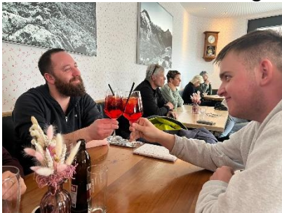
Gruppe Spass mit Aperol

Die Mehrheit hat sich dabei für die klassische Kombination aus Skihose und Skijacke entschieden. Allerdings haben sich auch noch drei Einhörner unter die Schar gemischt, welche etwas Farbe in das eher graue Wetter gebracht haben. Danach haben wir Skier und Snowblades montiert und uns auf die Piste begeben. Nach einigen schönen Fahrten gab es für uns Mittagessen im Restaurant bei der Chue-Bar. Am Nachmittag haben wir es aufgrund des Wetters und des aufkommenden Durstes nicht mehr so lange ausgehalten und sind darum bald in der Talstation auf ein oder zwei Bier eingekehrt.