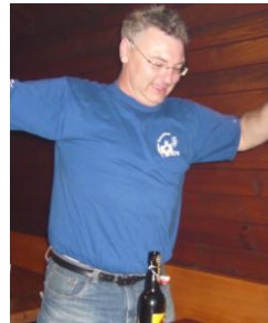
...die gute Laune